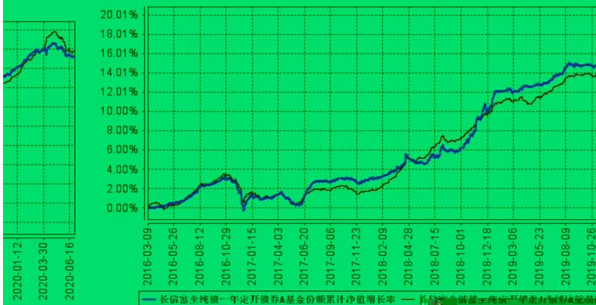
长信富全纯债一年定开债A基金份额累计净值增长率与同期业绩比较基准收益率的历史走势对比图