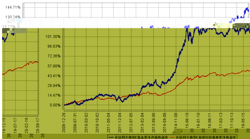
长信利丰债券C基金累计净值收益率与同期业绩比较基准收益率的历史走势对比图