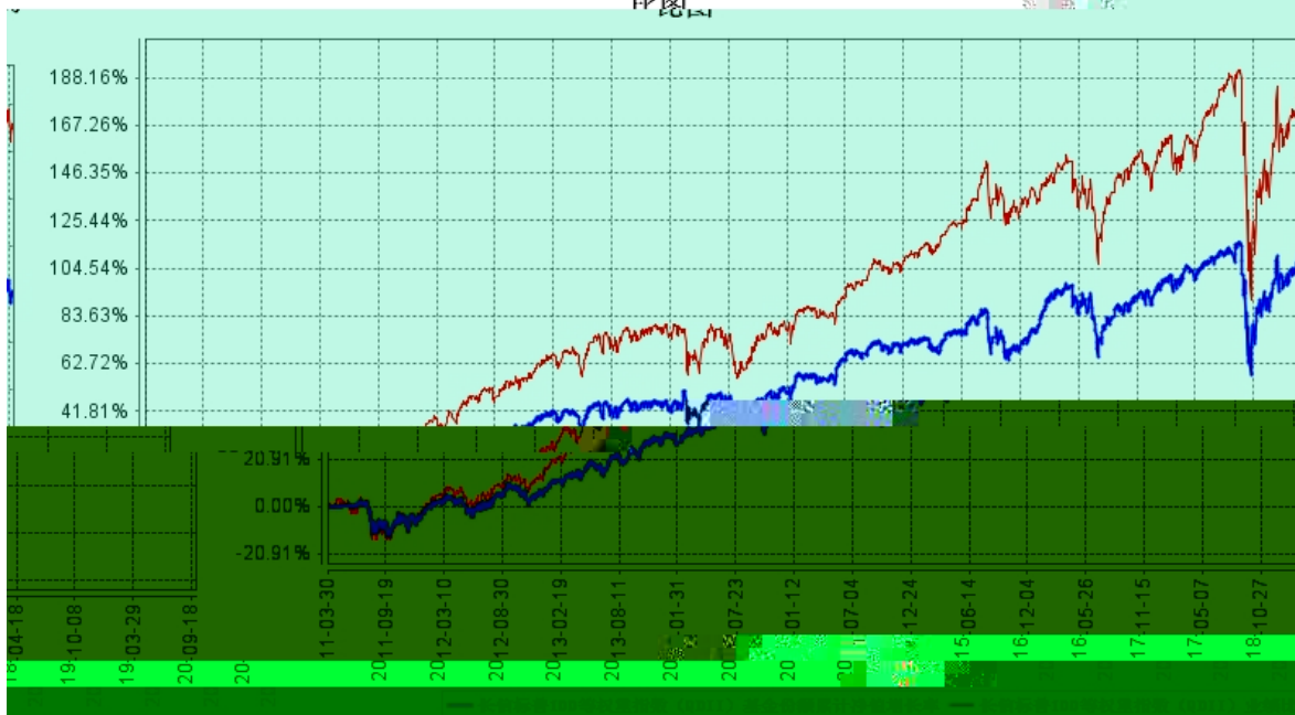
长信标普100等权重指数（QDII）基金份额累计净值增长率与同期业绩比较基准收益率的历史走势对比图