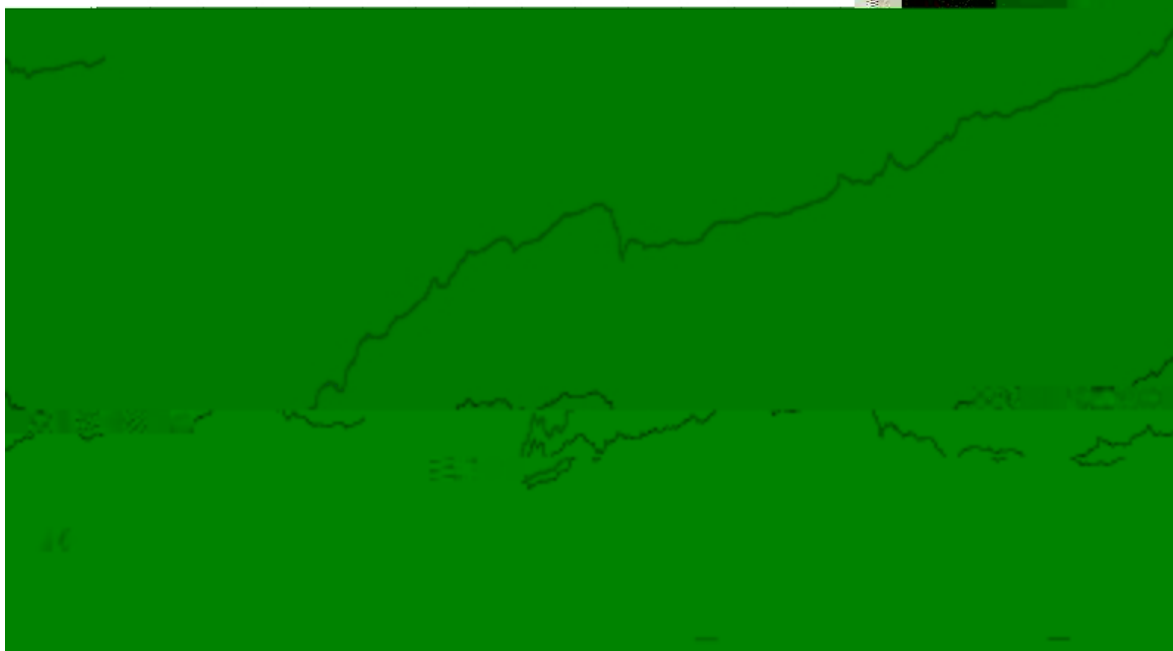
长信纯债壹号债券C基金份额累计净值增长率与同期业绩比较基准收益率的历史走势对比图