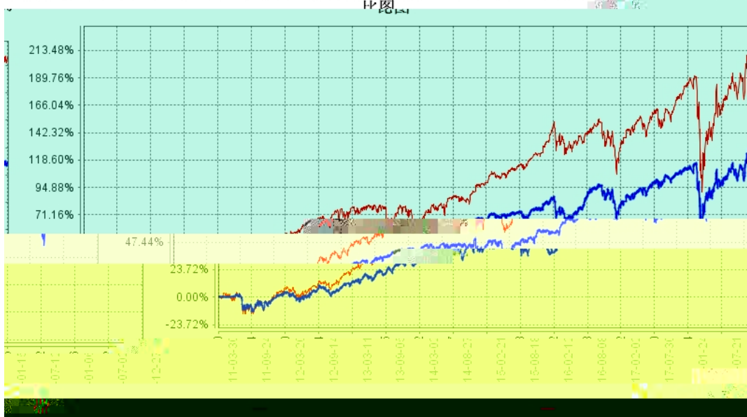
长信标普100等权重指数（QDII）基金份额累计净值增长率与同期业绩比较基准收益率的历史走势图