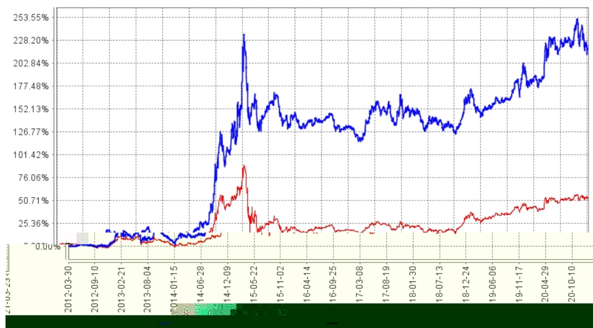
长信可转债债券A基金份额累计净值增长率与同期业绩比较基准收益率的历史走势对比图