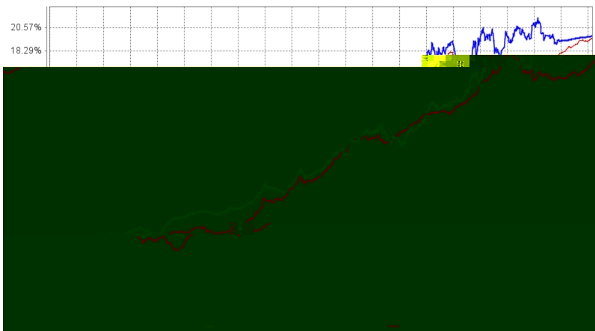
长信利鑫债券 (LOF) A 基金份额累计净值增长率与同期业绩比较基准收益率的历史走势对比图