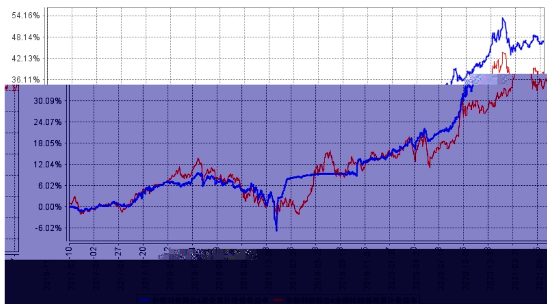
长信利信混合A基金累计净值收益率与同期业绩比较基准收益率的历史走势对比图