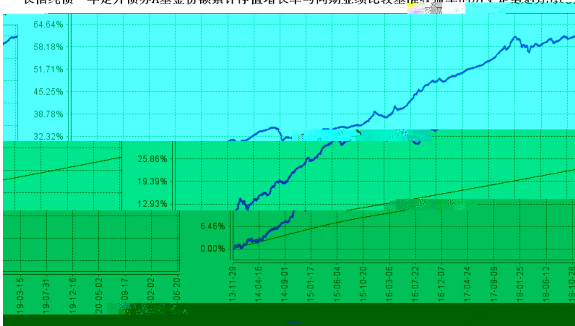
长信纯债一年定开债券A基金份额累计净值增长率与同期业绩比较基准收益率的历史走势对比图