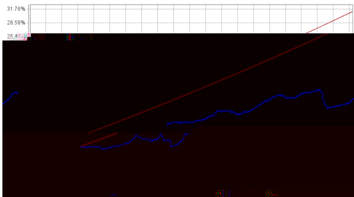
长信富民纯债一年定开债券A基金份额累计净值增长率与同期业绩比较基准收益率的历史走势对比图