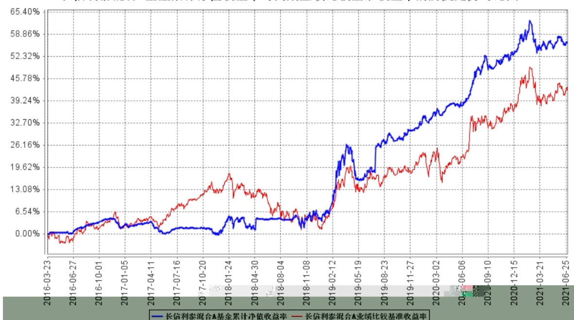
长信利泰混合A基金累计净值收益率与同期业绩比较基准收益率的历史走势对比图