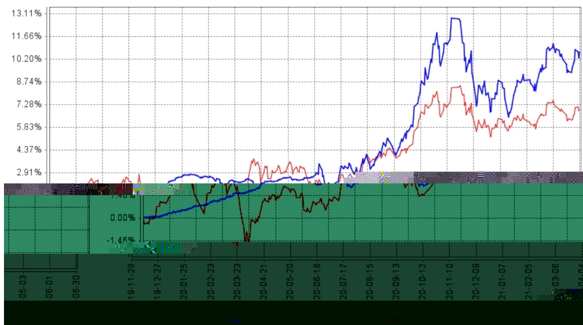
长信易进混合A基金份额累计净值增长率与同期业绩比较基准收益率的历史走势对比图