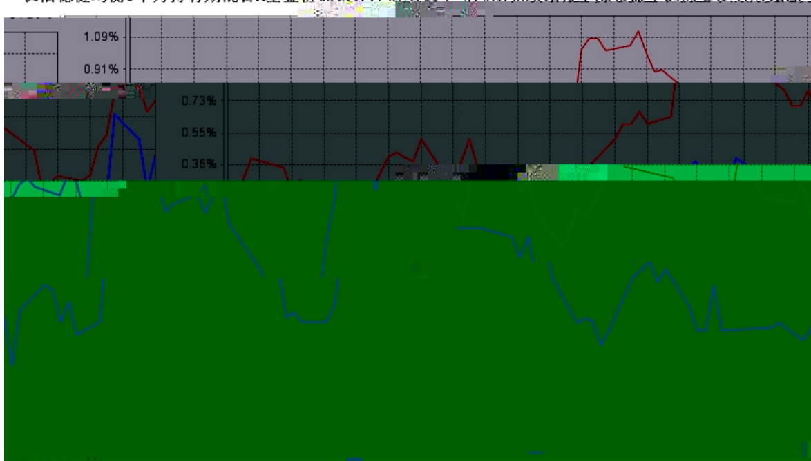
长信稳健均衡6个月持有期混合A基金份额累计净值增长率与同期业绩比较基准收益率的历史走势对比图