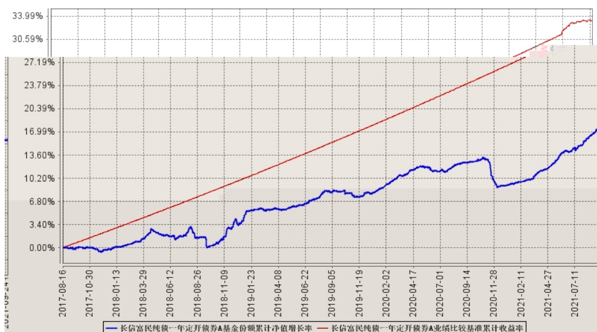
长信富民纯债一年定开债券A基金份额累计净值增长率与同期业绩比较基准收益率的历史走势对比图