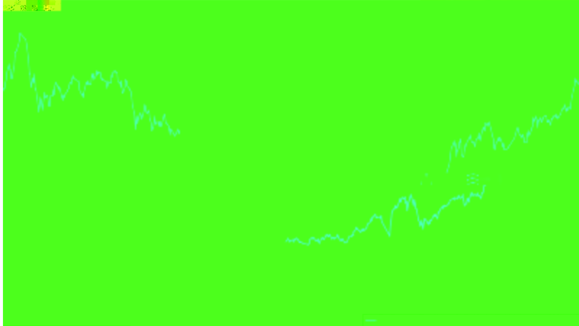
长信双利优选混合A基金份额累计净值增长率与同期业绩比较基准收益率变动的比较