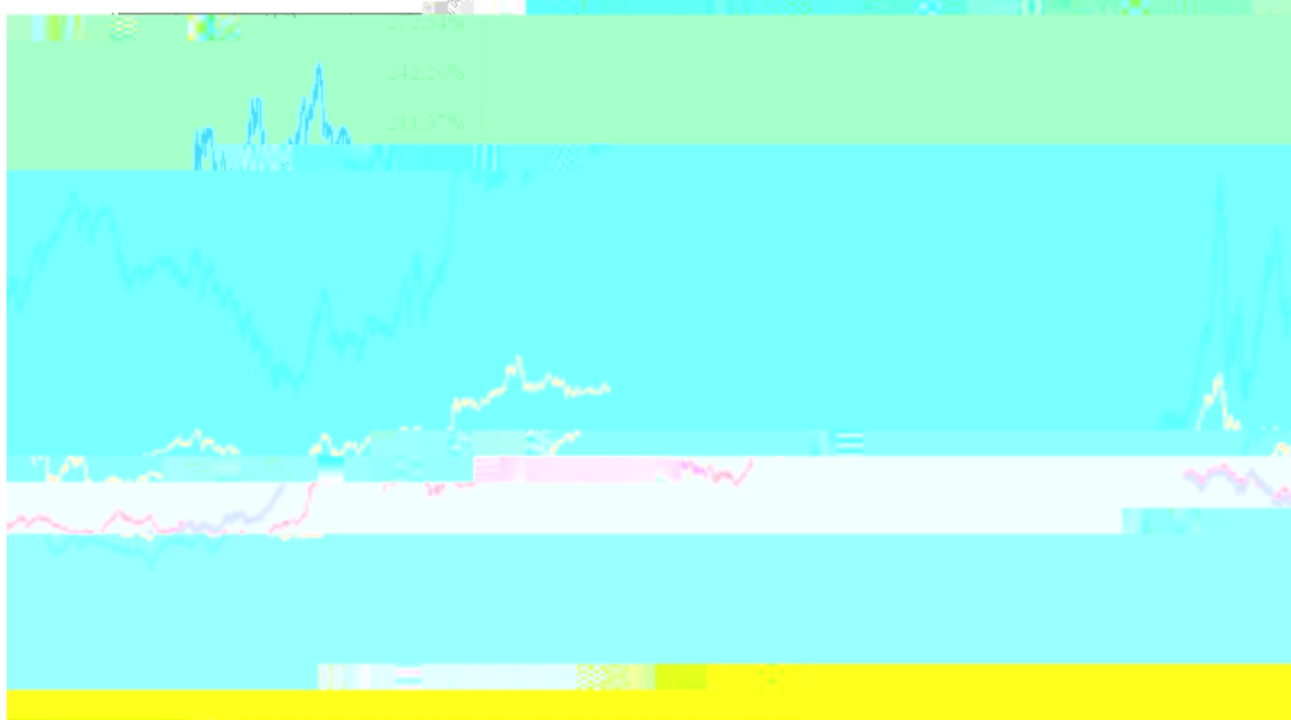
长信量化先锋混合C基金份额累计净值增长率与同期业绩比较基准收益率的历史走势对比图