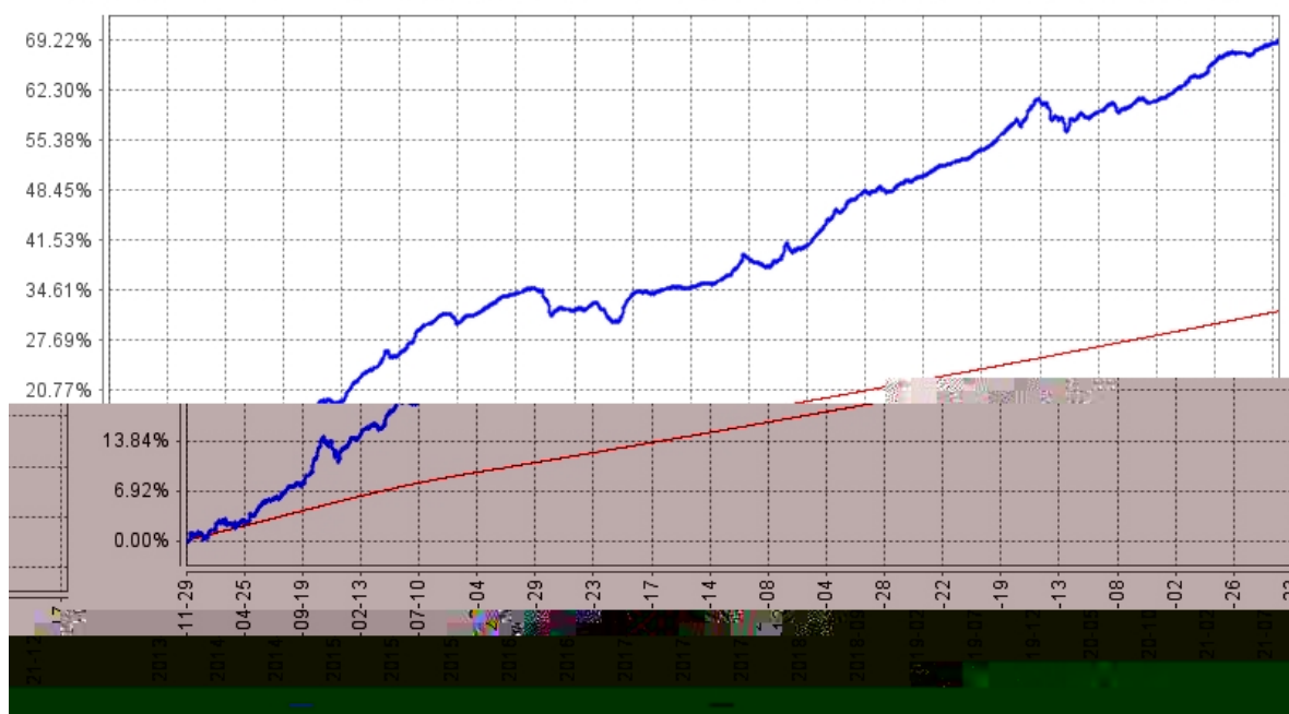
长信纯债一年定开债券A基金份额累计净值增长率与同期业绩比较基准收益率的历史走势对比图