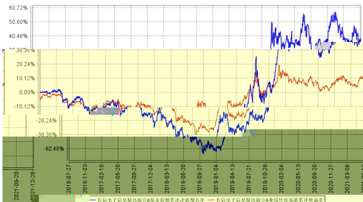
长信电子信息量化混合A基金份额累计净值增长率与同期业绩比较基准收益率的历史走势对比图