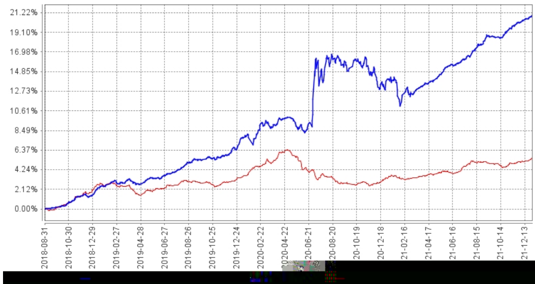
长信稳裕三个月定开债券发起式基金份额累计净值增长率与同期业绩比较基准收益率的历史走势对比图