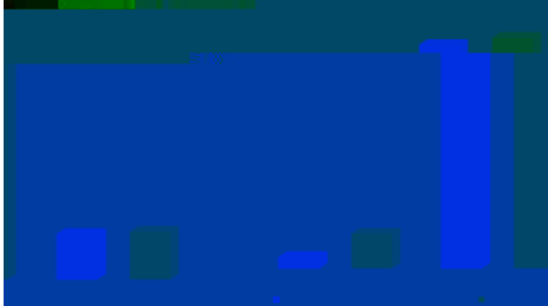
长信颐天养老三年持有混合（FOF）A自基金合同生效以来基金每年净值