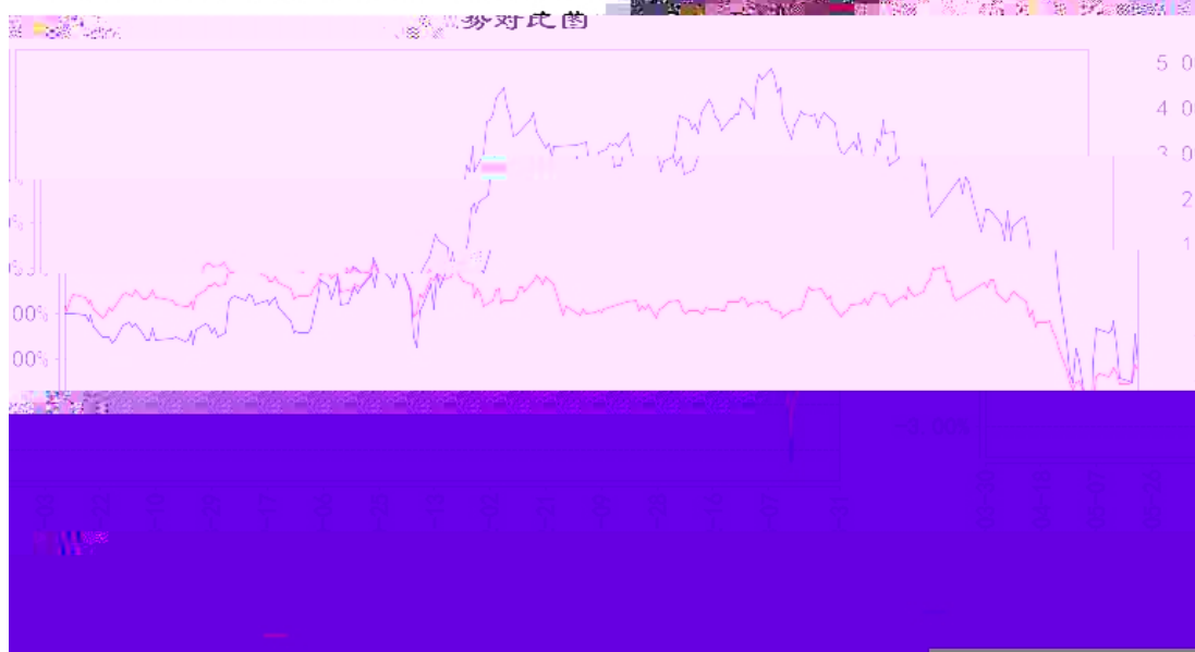
长信稳健均衡6个月持有期混合A累计净值增长率与同期业绩比较基准收益率的历史