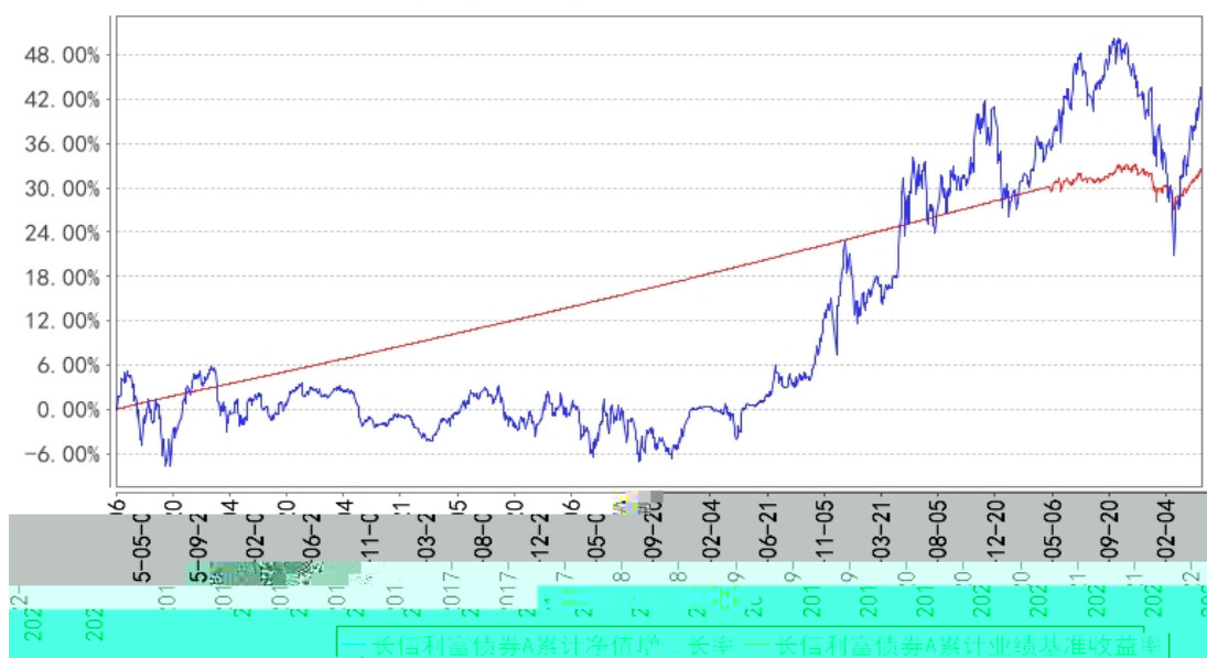
长信利富债券A累计净值增长率与同期业绩比较基准收益率的历史走势对比图