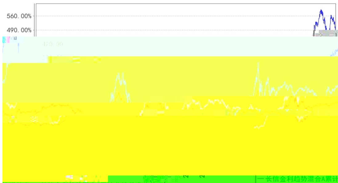
长信金利趋势混合A累计净值增长率与同期业绩比较基准收益率的历史走势对比图