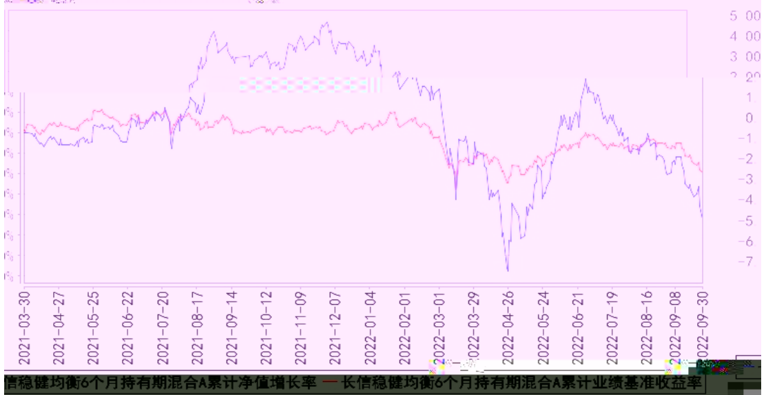
长信稳健均衡6个月持有期混合A累计净值增长率与同期业绩比较基准收益率的历史对比图