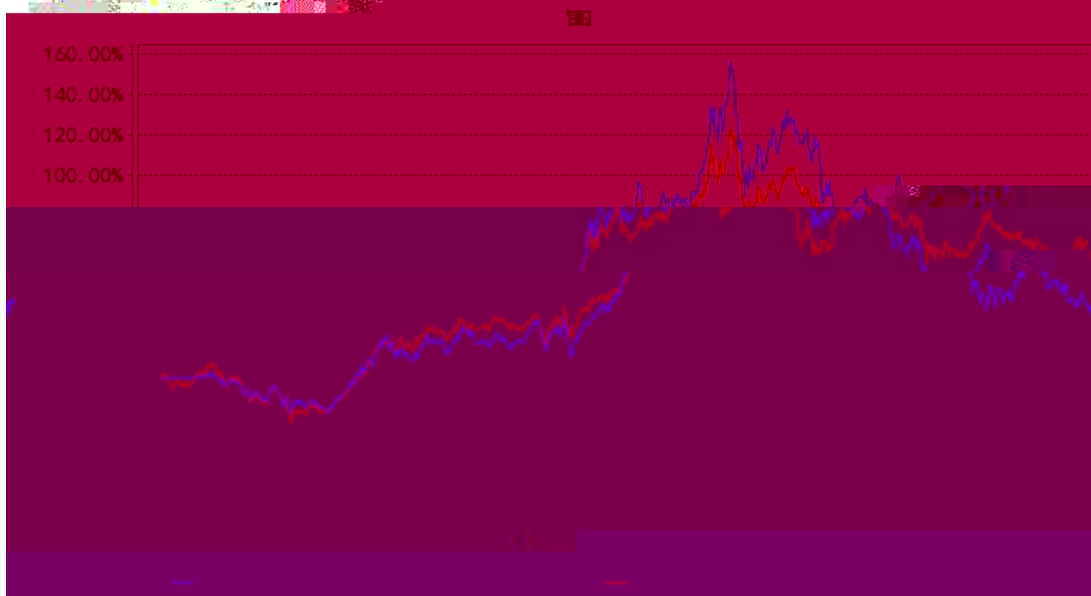
长信消费精选量化股票A累计净值增长率与同期业绩比较基准收益率的历史走势对比