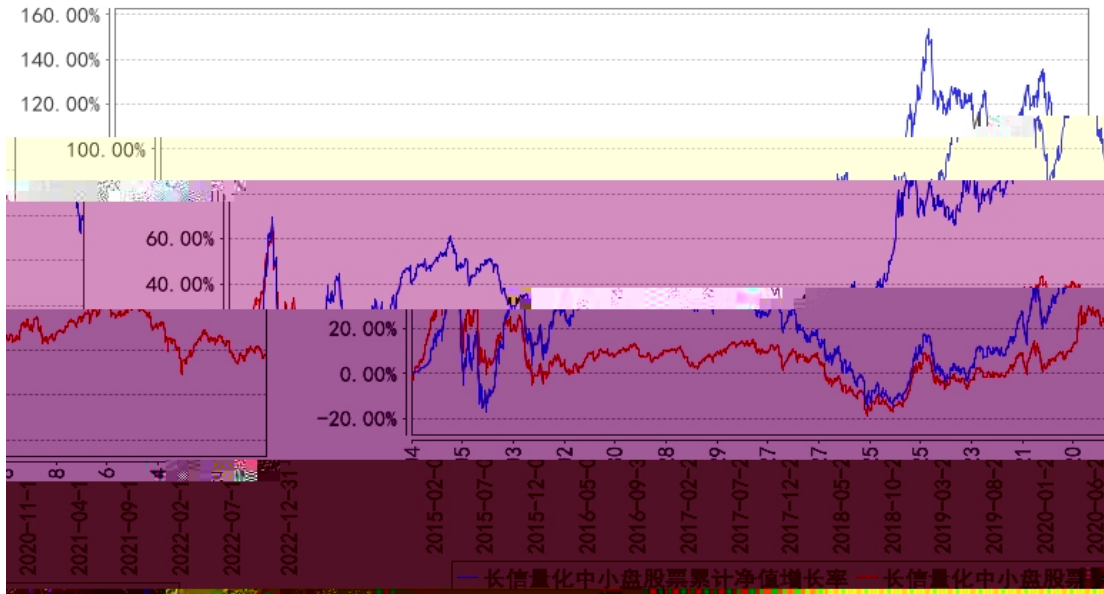
长信量化中小盘股票累计净值增长率与同期业绩比较基准收益率的历史走势对比图