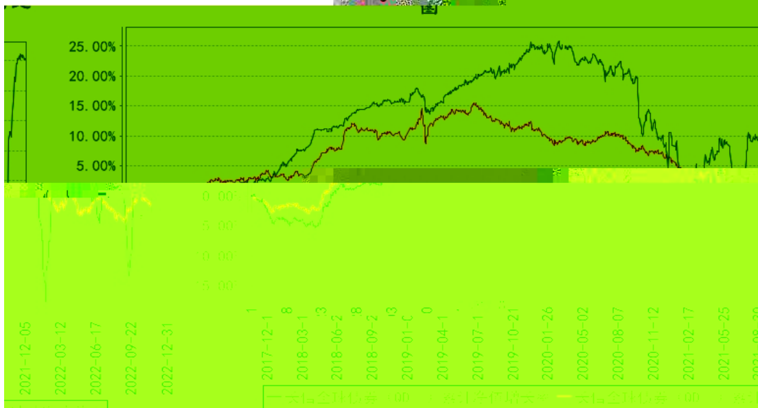
长信全球债券（QDII）累计净值增长率与同期业绩比较基准收益率的历史走势对比图