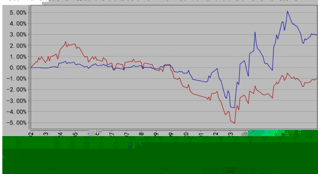
长信稳健成长混合A累计净值增长率与同期业绩比较基准收益率的历史走势对比图