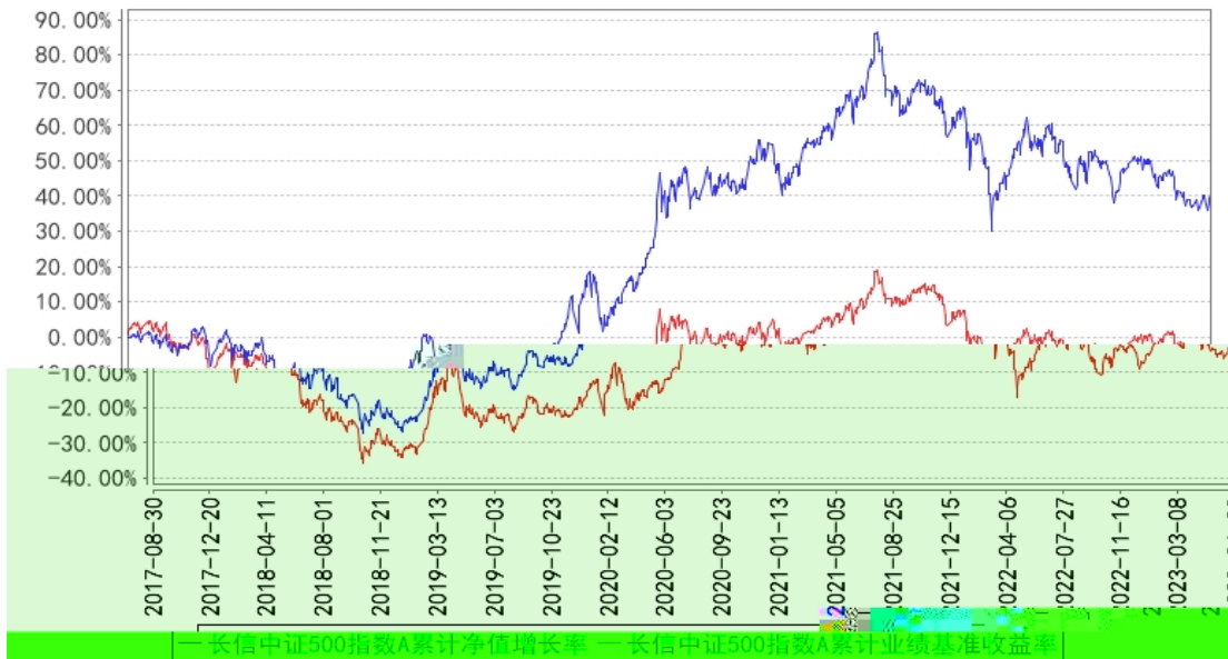
长信中证500指数A累计净值增长率与同期业绩比较基准收益率的历史走势对比图