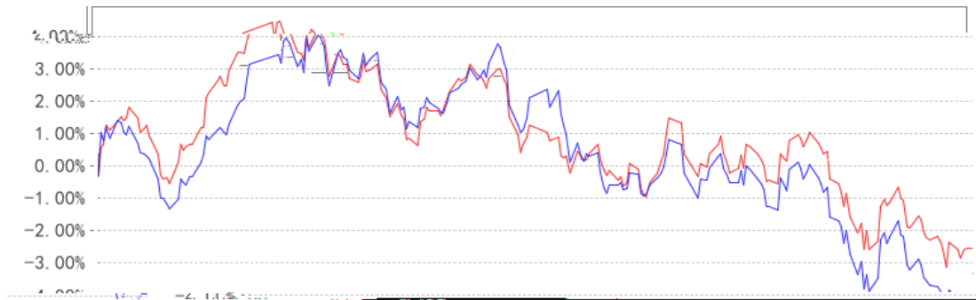
长信颐天养老三年持有混合 (FOF) Y累计净值增长率与同期业绩比较基准收益率的历史走势对比图