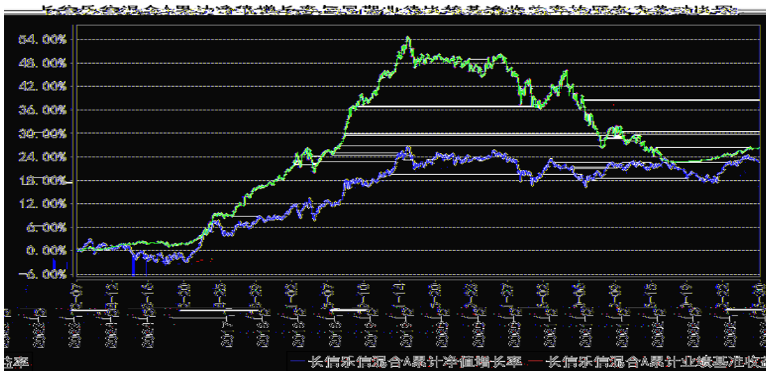
长信乐信混合C累计净值增长率与同期业绩比较基准收益率的历史走势对比图