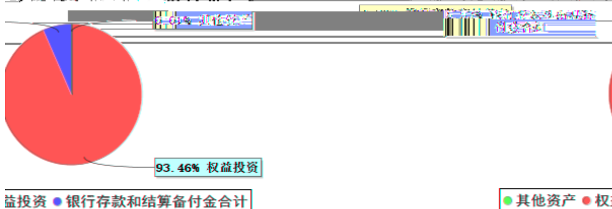
投资组合资产配置图表(2024年3月31日)