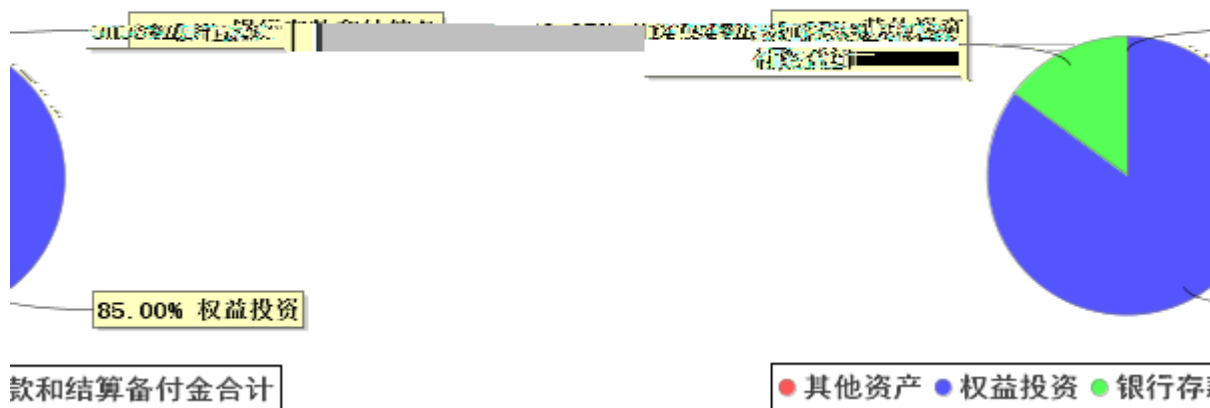
投资组合资产配置图表(2024年12月31日)