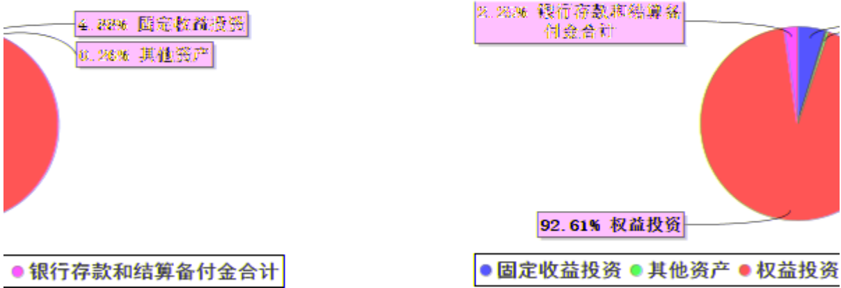
投资组合资产配置图表 (2025年9月30日)