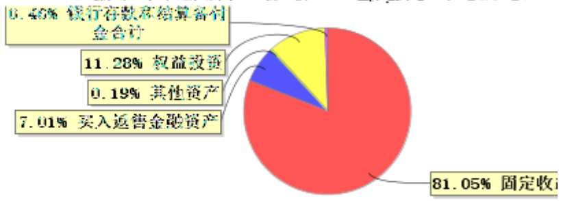
长信利丰债券C基金资产配置情况(2024年12月31日)