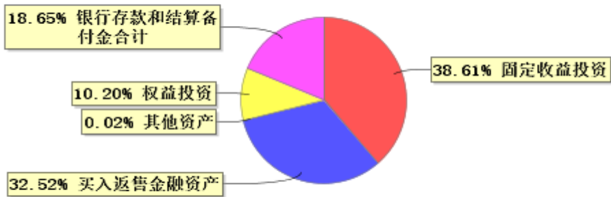
投资组合资产配置图表(2025年12月31日)