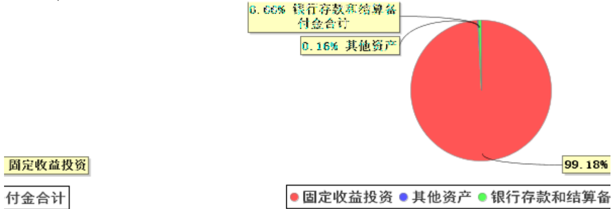
图 1 基金资产净值构成图 (截至 2025 年 10 月 31 日)